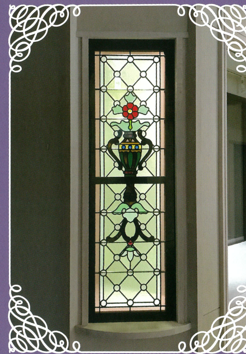
横浜最古1908年のステンドグラス（複製）

Yokohama Eiwa Gakuin Nagai Memorial School History Exhibition Room