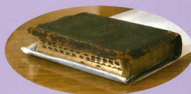
130年前アメリカの教会から贈られた聖書